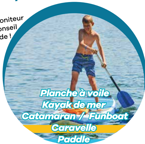
Planche à voile Kayak de mer Catamaran / Funboat Caravelle Paddle