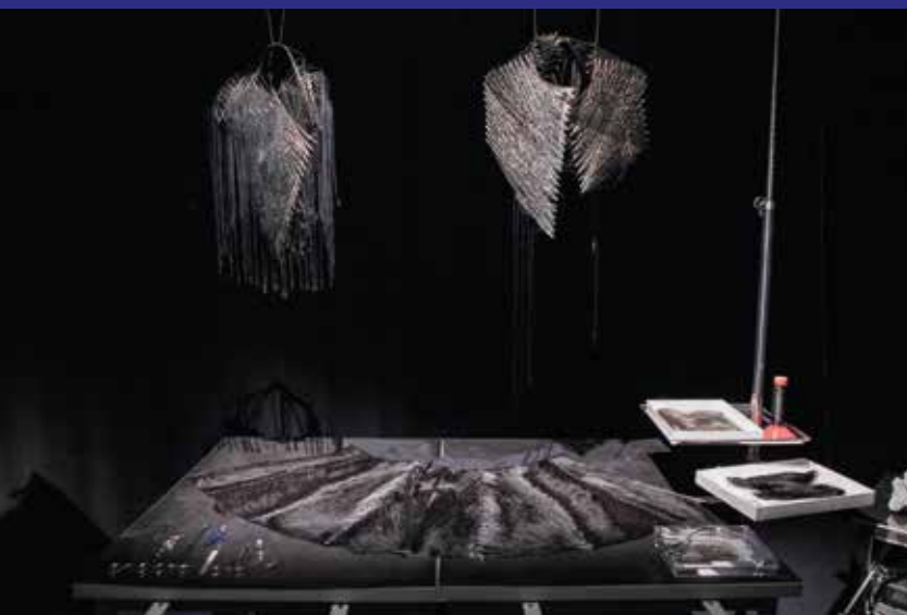
8. Michel Paysant Vase pour les yeux, 2020